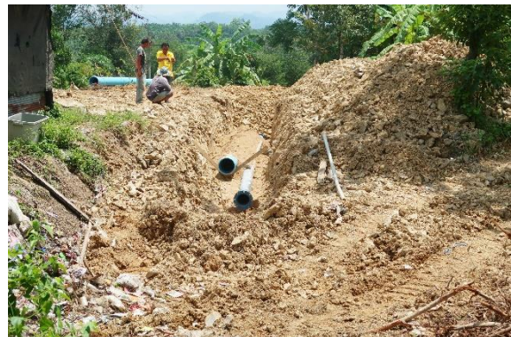
งานติดตั้งระบบท่อส่งน้ำ