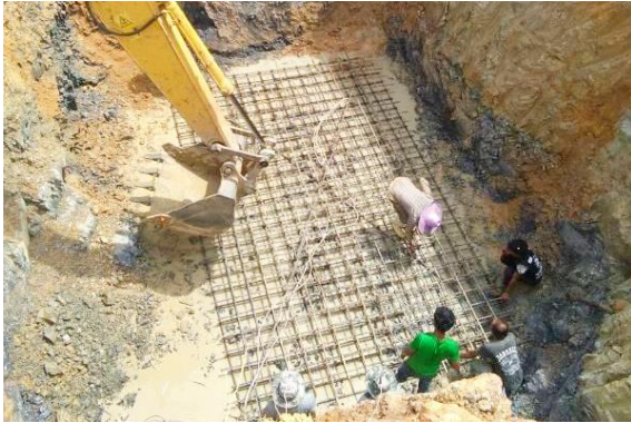
งานก่อสร้างบ่อซักน้ำดิบ

เมื่อดำเนินการแล้วเสร็จ จะสามารถส่งน้ำสนับสนุนการอุปโภคบริโภคให้ราษฎร จำนวน ๙ หมู่บ้าน ในพื้นที่ตำบลนิคมพัฒนา อำเภอมะนัง จังหวัดสตูล จำนวนประมาณ ๒,๓๔๙ ครัวเรือน ราษฎร ๗,๖๖๓ คน ได้มีน้ำใช้อย่างเพียงพอตลอดทั้งปี ซึ่งส่งผลให้ราษฎรมีรายได้ คุณภาพชีวิต และความเป็นอยู่ที่ดีขึ้น