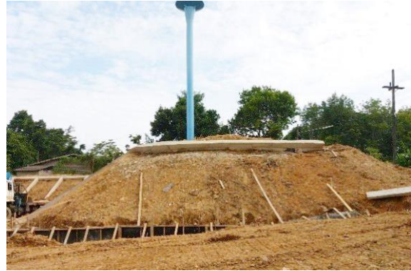
งานก่อสร้างโรงกรองน้ำ